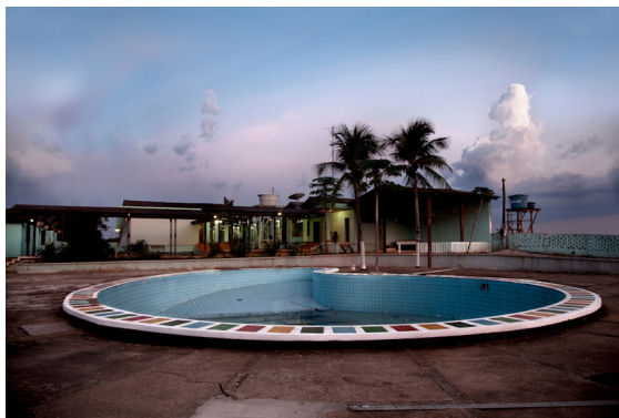
Fig. 1. Romy Pocztaruk: A Última Aventura, Rurópolis I , 2011, 100x150 cm. Disponível em: http://romypocz.com . Acesso em: 1 de agosto de 2015.

ideia de viagem e percurso. O que vai acontecer ou não está fora do processo inicial do trabalho. E as coisas sempre acabam acontecendo de outra maneira. (POCZTARUK, 2014)