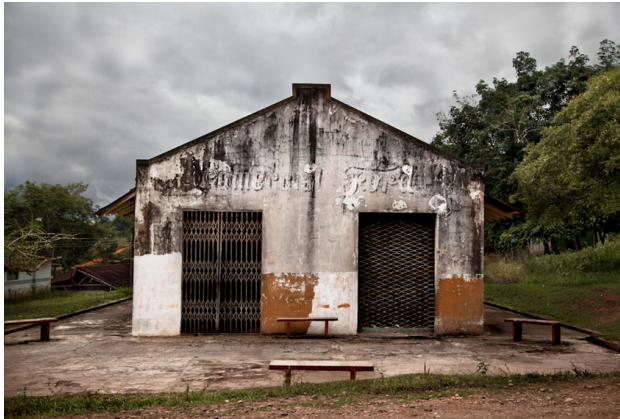
Fig. 2. Romy Pocztaruk: Última Aventura, Forlândia I , 2011, 100x150 cm. Disponível em: http://romypocz.com . Acesso em: 1 de agosto de 2015.

Pocztaruk foi convidada a apresentar a série produzida, chamada A Última Aventura , que foi exibida em uma sala da mostra de arte contemporânea realizada entre setembro e novembro de 2014.