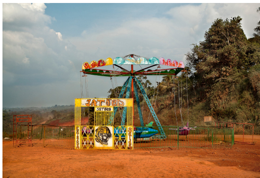
Fig. 4. Romy Pocztaruk: A Última Aventura, Jatões , 2011, 100x150 cm. Disponível em: http://romypocz.com . Acesso em: 1 de agosto de 2015.

Assim, a fotografia é uma construção a partir de escolhas que, no máximo, dão conta de parte do real, um real colocado em dúvida por se apresentar nublado