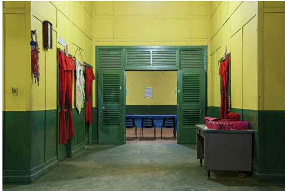
Fig. 6. Romy Pocztaruk: A Última Aventura, Fordlândia XVI , 2011, 100x150 cm.

inconclusos e suas utopias fracassadas, Pocztaruk se faz presente e nos faz presente. Ou melhor, a câmera faz a artista e o observador presentes. E, tão logo a cena é recolhida, já se faz ausente.