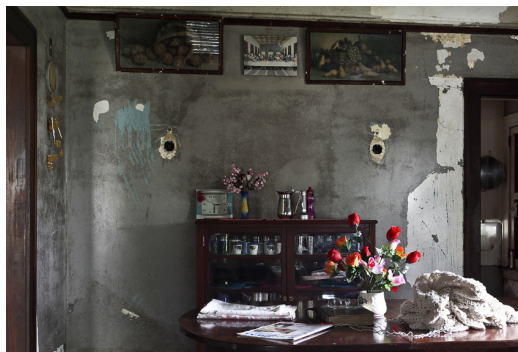
Fig. 7. Romy Pocztauruk: A Última Aventura, Fordlândia XVII , 2011, 100x150 cm. Disponível em: http://romypocz.com . Acesso em: 1 de agosto de 2015.

As ruínas da modernidade e as utopias fracassadas oferecem, enquanto temas desenvolvidos pela artista, um regime de imagens em um tempo complexo, simultaneamente passado, presente e futuro. Há diversos vetores concorrendo sob diferentes níveis temporais, a começar pela noção de instantâneo. Em suas temporalidades múltiplas, diz Antonio Fatorelli (2012), o instantâneo sublinha o status múltiplo e reprodutivo da fotografia, não sem estabelecer uma relação problemática com o tempo e o referente.